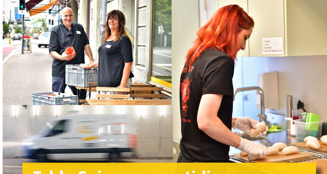
Table Suisse au quotidien