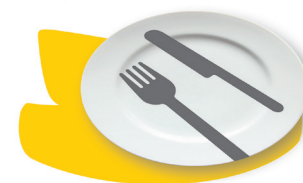
Table Suisse récupérer – distribuer – nourrir

Notre lutte au quotidien réduire le gaspillage alimentaire et la pauvreté